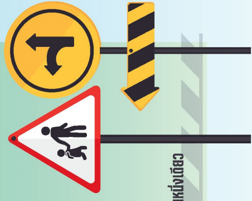
สร้างสมรรถภาพเชิงอำเภอ เป็นแห่งเดียว